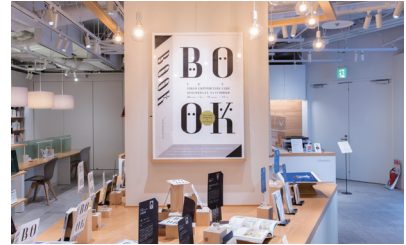
上:「COPY BOOK」がモチーフの展示会場 下:ライブラリー連動企画「2021受賞者によるセレクトブック展」のコーナー