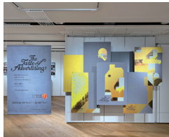
左:タイトルビジュアルが並ぶ会場入り口 中:展示会場の風景 右:企画展のポスター

会場内には、当館のアーカイブ資料を活用し、第73回・第74回と2年連続して総合賞を受賞したサントリーホールディングスの「缶コーヒーBOSSの歴史」「サントリー名作アーカイブ」が閲覧できるコーナーも設置されました。