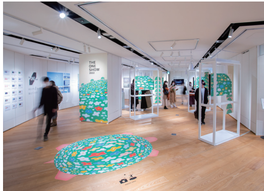
左: 第1弾「THE ONE SHOW 2022」の会場風景。右: 土台をテーマに、亀をモチーフにしたキービジュアルで会場を演出