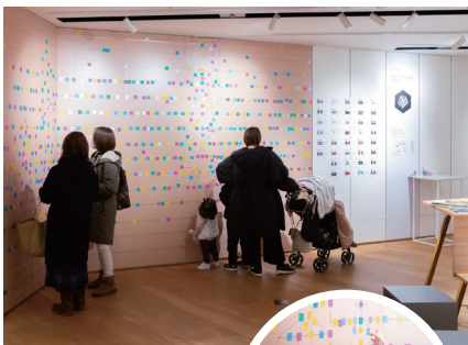
来館者が展示作品からお気に入りの作品番号を、ステッカーに書いて貼っていく参加型コーナー