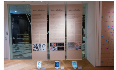
受賞者へのインタビューをまとめた「Voices & Insights」コーナーでは3作品を紹介

題を知るきっかけになるものまで。世の中の“いま”を反映した、刺激と発見にあふれる広告クリエイティブとデザインをご紹介します。世界が賞賛した作品をお楽しみいただける展覧会です。