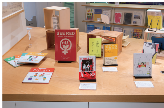
ライブラリーでは、連動企画として「世界のクリエイティブを“ひらく”本」と題して、展示テーマを掘り下げた図書コーナーを設置。「自らをひらくこと」「多様性と想像力」「人のためのテクノロジー」「身の丈の環境問題」という4つのトピックで書籍を展示