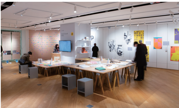
第1弾「D&AD Awards 2023」会場風景。映像作品だけでなく、ポスター、本、雑誌、パッケージなど、数多くの現物作品を展示した