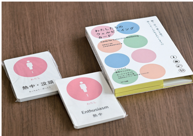
自分や周囲の人々が大切にしている「ウェルビーイング」の要因を見える化し、対話を通じて共有するためのカード型ツール