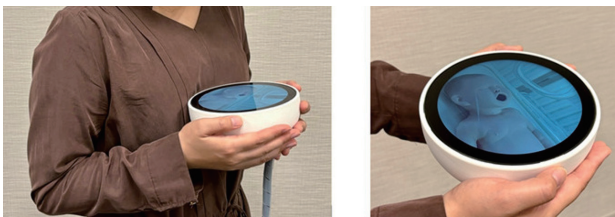
岩手医科大学との共同研究でのデバイスのプロトタイプ。ウェブカメラで撮影した新生児の様子をディスプレイに映し、新生児の心拍のリズムに合わせて、鼓動を模した振動を提示。遠隔でも我が子に触れて心臓の鼓動を感じるような体験ができる

ただし、こうしたサービスはマーケットが小さいことが多く、企業として中長期的にどのように経済的価値と結び付け、継続させていくかが今後の課題です。