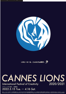
「CANNES LIONS 2020/21」ポスター