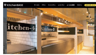
ゴーストレストランのためのシェアキッチン「キッチンベース」のWebサイト。 https://kitchenbase.jp/

マンが主流のようである。また、「シェアキッチン」は最近話題のゴーストレストランから連想されるように、新規の飲食ビジネス目的の場所として見られているのかもしれない。